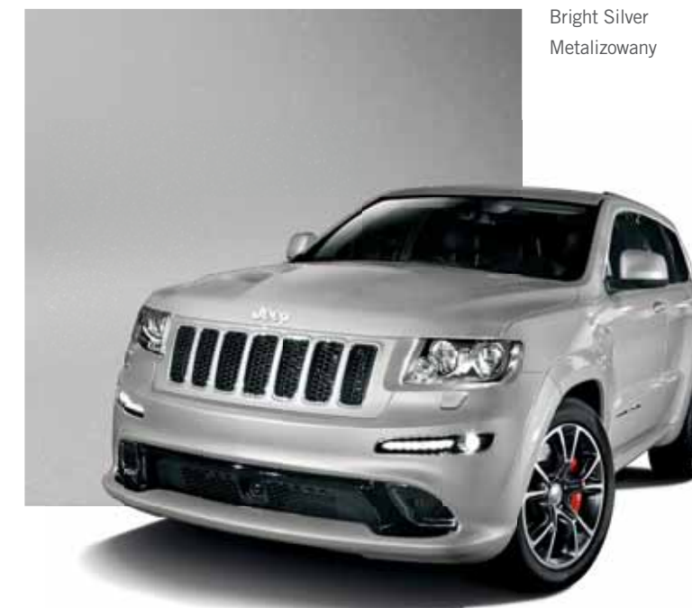
Bright Silver Metalizowany