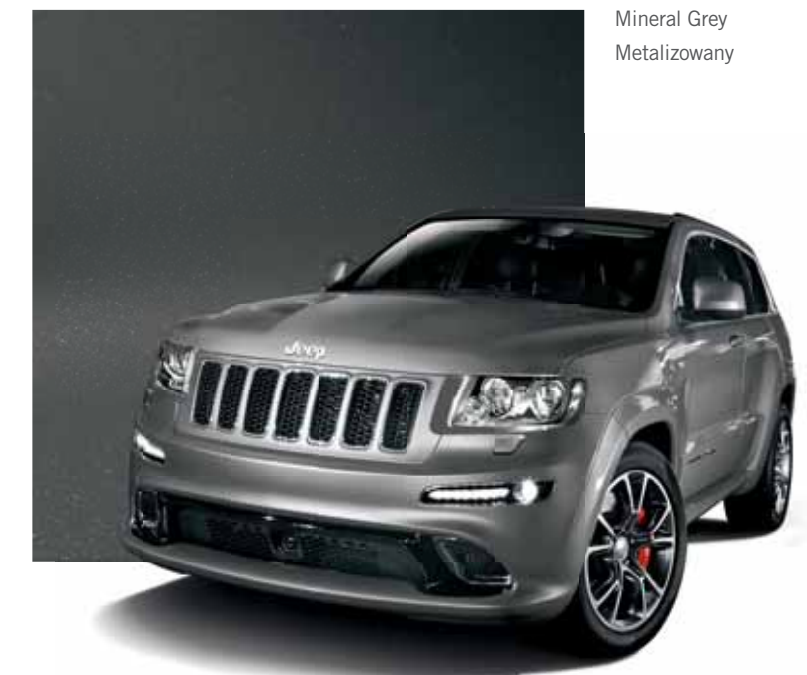
Mineral Grey Metalizowany