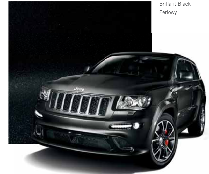
Brilliant Black Perłowy