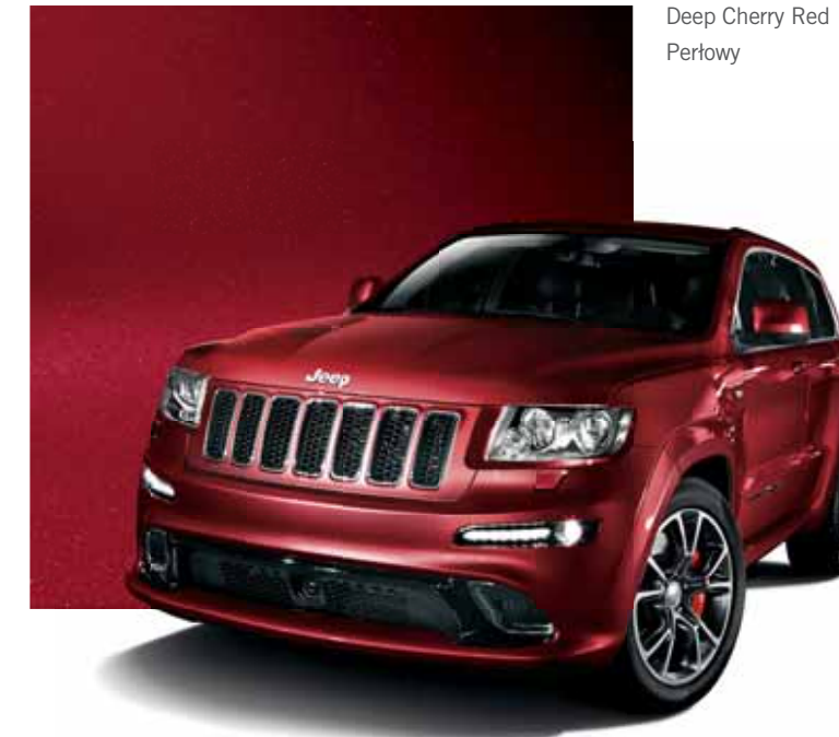
Deep Cherry Red Perłowy