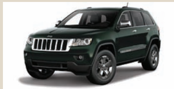
Black Forest Green (PGZ) Metallic (802)