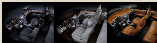
Premium Nappa Ledersitze (Overland) Black Leather (1GL) Dark Frost/Beige Light Leather (2GL) Black/New Saddle Leather (XGL) (Overland Summit)