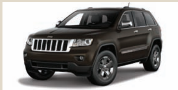
Rugged Brown (PTW) Metallic (802)