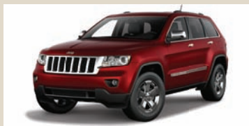
Deep Cherry Red (PRP) Metallic (802)