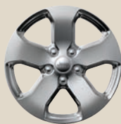
Laredo/Limited 18" Aluminiumfelgen 265/60R18 Bereifung