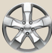
Polierte Aluminiumräder Overland Summit Design 20" Aluminiumfelgen 265/50R20 Bereifung