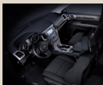
Premium Stoffsitze (Laredo) Black Cloth (1F7)