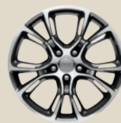
Aluminiumfelge SRT® Design 20" Aluminiumfelgen 295/45ZR20 Bereifung