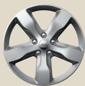
Aluminiumfelge Overland Design 20" Aluminiumfelgen 265/50R20 Bereifung