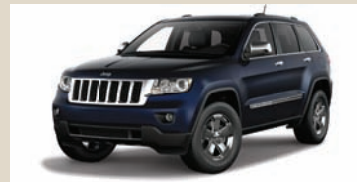
True Blue (PBU) Metallic (802)