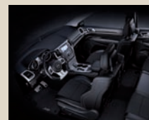
SRT® Performance Nappa Ledersitze mit Wildledereinsätzen Black Leather Trimmed Seats with preferred Suede (1DZ)