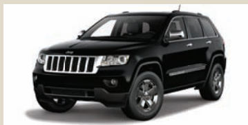
Brilliant Black (PXR) Metallic (802)