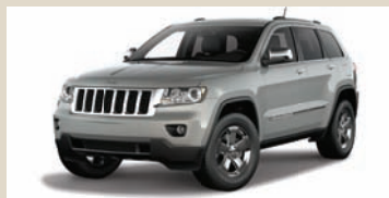
Bright Silver (PS2) Metallic (210)