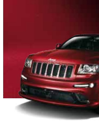
أحمر كرزى كريستالي تؤلؤي غامق Deep Cherry Red Cristal Pearl