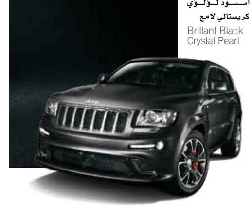
أسود لؤلؤي كريستالي لامع Brilliant Black Crystal Pearl