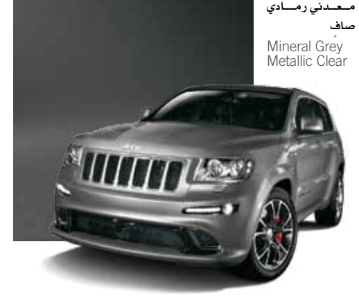
معدني رمادي صاف Mineral Grey Metallic Clear