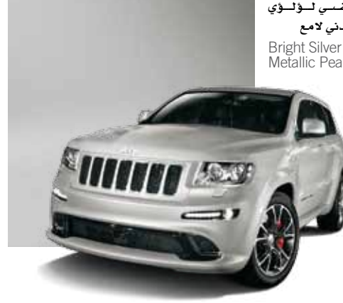
فضي لؤلؤي معدني لامع Bright Silver Metallic Pearl